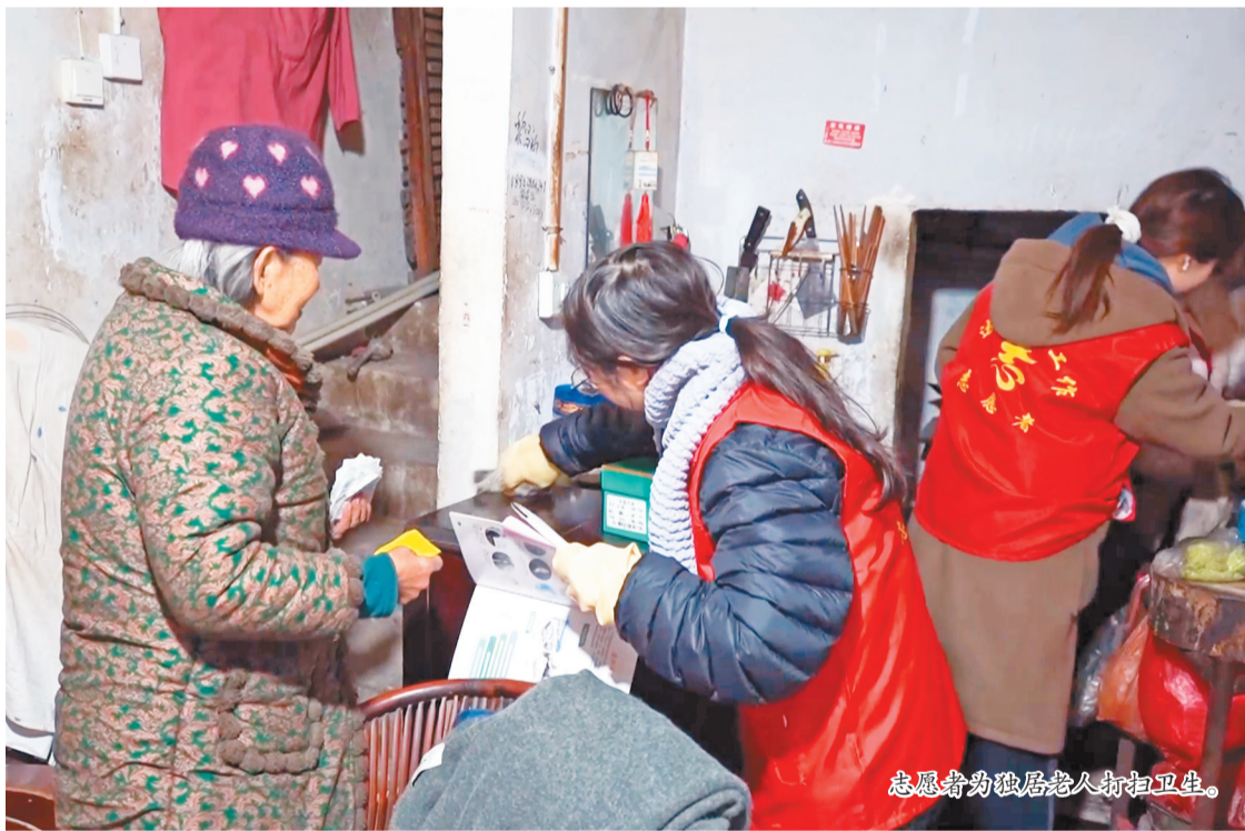
志愿者为独居老人打扫卫生。

本报讯(记者 陈纬 郑俊)春节临近,达川区近日组织开展“干净过大年·温暖在身边”新春系列志愿服务活动,为辖区内独居、高龄老人提供上门清扫和亲情陪伴,以实实在在的行动传递社会关爱,让老人们在整洁的环境中迎接马年春节。