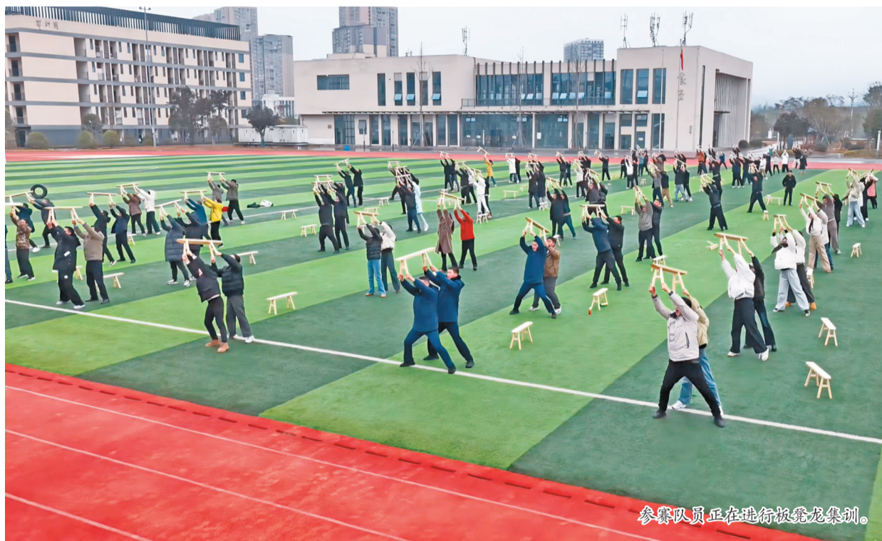
参赛队员正在进行板凳龙集训。

本报讯(记者 魏磊 潘莉莉 张浩 摄影报道)春节前夕,国家级非遗项目安仁板凳龙千人大赛将在达州东部经开区举行。近日,22支参赛队伍、近千名队员正以饱满热情投入紧张集训,用灵动舞姿唤醒非遗活力,为新春佳节注入独特的