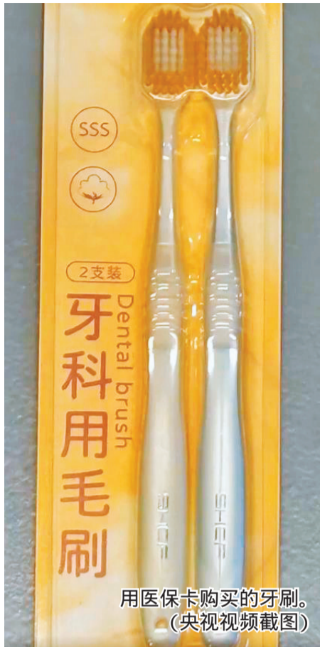
用医保卡购买的牙刷。 (央视视频截图)