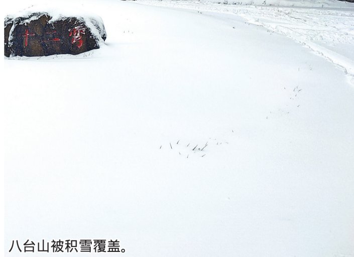
八台山被积雪覆盖。