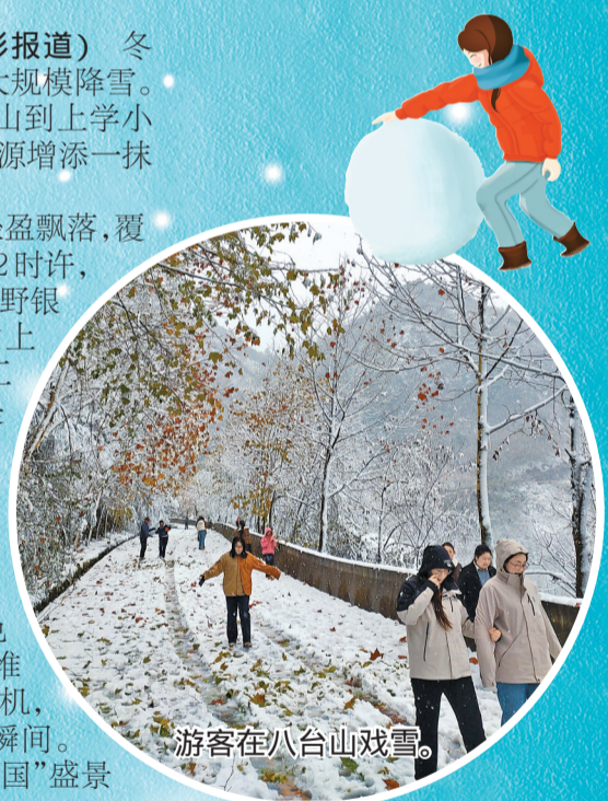
游客在八台山戏雪。

除了万源市的高海拔地区和北部乡镇,就连万源城区周边的山峦也披上银装。市民抬头即见雪山,城市与雪景相映成趣,“雪山下的城市”跃然眼前。