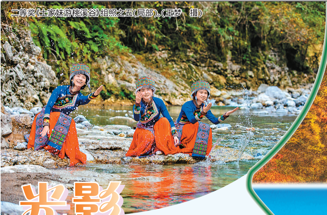
二等奖《土家妹游桃溪谷》组照之五(局部)。