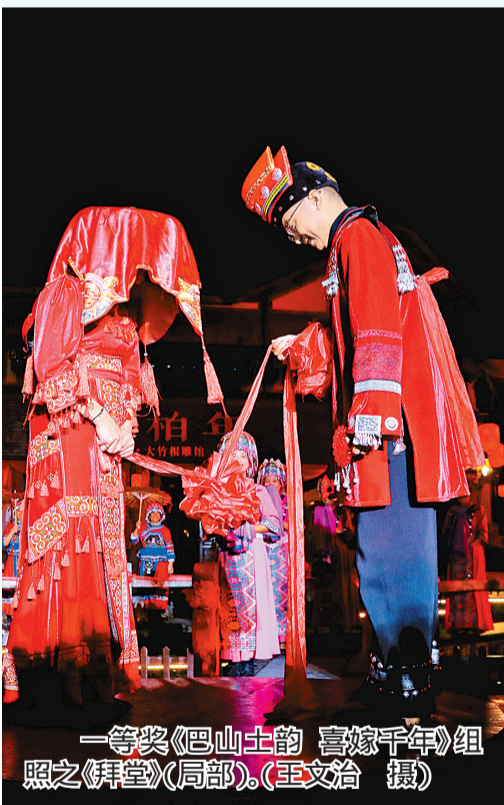
一等奖《巴山土韵 喜嫁千年》组照之《拜堂》(局部)。

从秋到冬, 从绚烂到纯粹, 在季节流转间, 摄影爱好者们终于完成了巴山大峡谷风景长卷中极为动人的一章的誊写。本期视觉选登部分获奖摄影作品, 以飨读者。