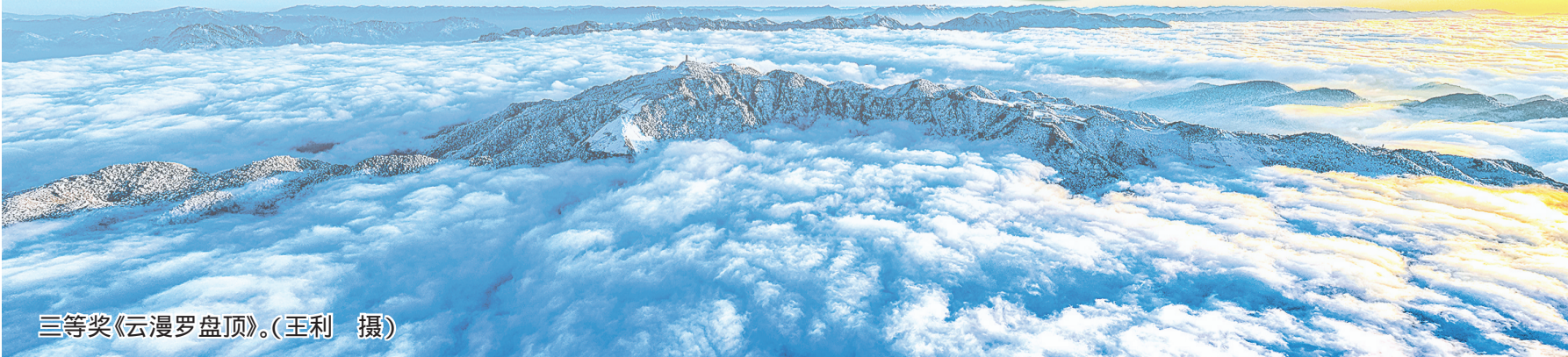
三等奖《云漫罗盘顶》。