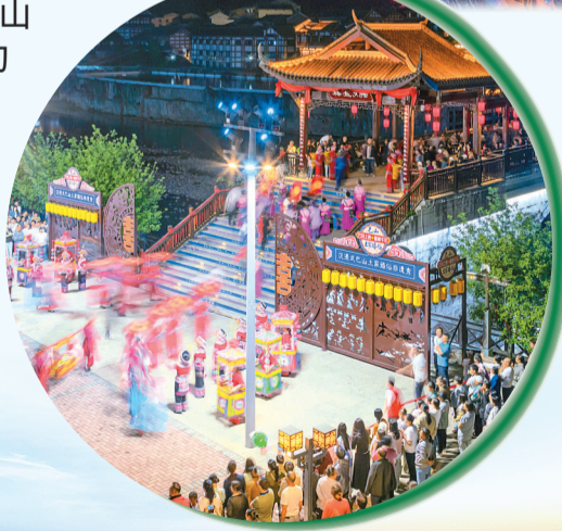
◀三等奖《巴山婚俗非遗秀》(局部)。