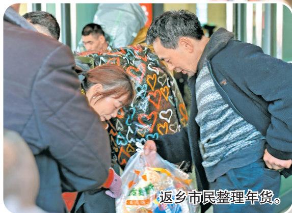
返乡市民整理年货。